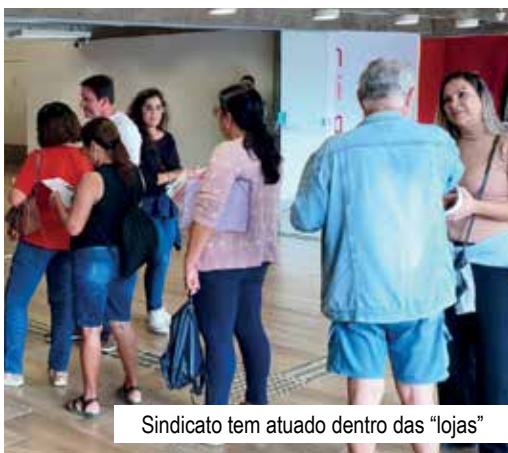
Sindicato tem atuado dentro das "lojas"

O Santander obteve lucro líquido de R$ 3,788 bilhões no 1º trimestre de 2026. O resultado representa queda de 1,9% em relação ao mesmo período de 2025. O lucro líquido caiu ainda mais (-7,3%) em relação ao trimestre imediatamente anterior, quando o banco alcançou R$ 4,023 bilhões.