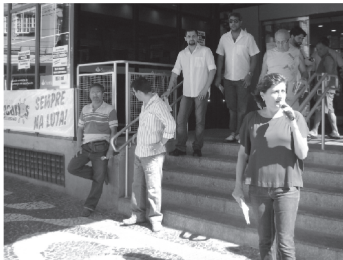
Paralisação do Santander no Centro de Santos - 20/01/10

Cabesp e Banesprev: renovação dos termos de compromisso de manutenção do patrocínio do Santander, com grupo de trabalho consultivo.