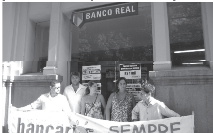
Paralisação do Real no Centro de Santos - 20/01/10

Auxílio-educação: ampliação de 1.250 para 2.000 bolsas de estudo, no valor de 50% da mensalidade com teto de R$ 330 mais reajuste de 6%, e manutenção das atuais bolsas concedidas aos funcionários do Real, respeitando os critérios vigentes, como a não-reprovação.