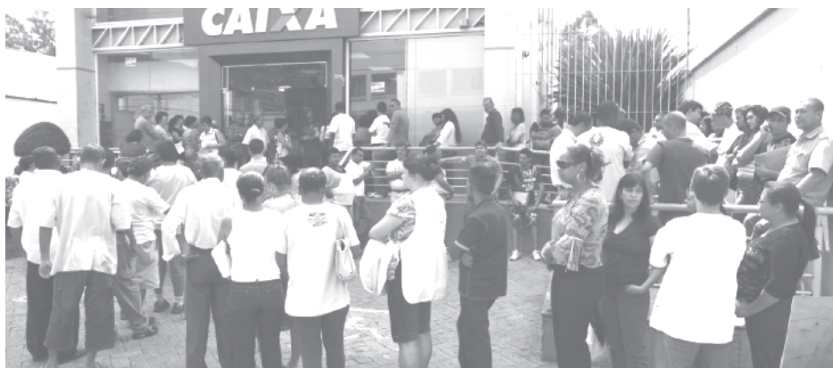
É constante a fila na CAIXA pela falta de funcionários

São aproximadamente 85 mil empregados que respondem pelos processos diários da empresa, apoiados por traba-