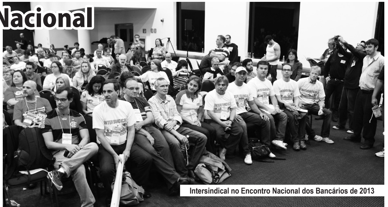
Intersindical no Encontro Nacional dos Bancários de 2013

Nestes encontros, os diretores do Sindicato discutiram e apresentaram propostas como fim das metas, do assédio e das demissões, além de salário mínimo do Dieese como piso (R$ 3.079,31), mais contratações, combate às terceirizações e aplicação da Convenção 158 da OIT, que proíbe as dispensas imotivadas, entre