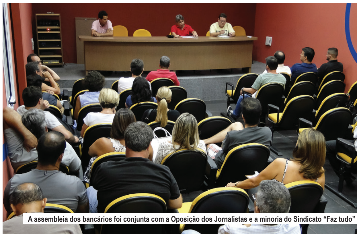
A assembleia dos bancários foi conjunta com a Oposição dos Jornalistas e a minoria do Sindicato “Faz tudo”

“Participamos do início da construção e das lutas da Intersindical desde 2005. Estamos