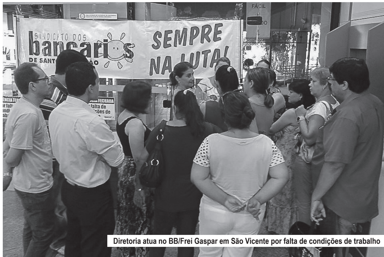
Diretoria atua no BB/Frei Gaspar em São Vicente por falta de condições de trabalho

A unidade do Santander - Praça Mauá, 16, foi paralisada por servir água infectada por pombo no reservatório de água.