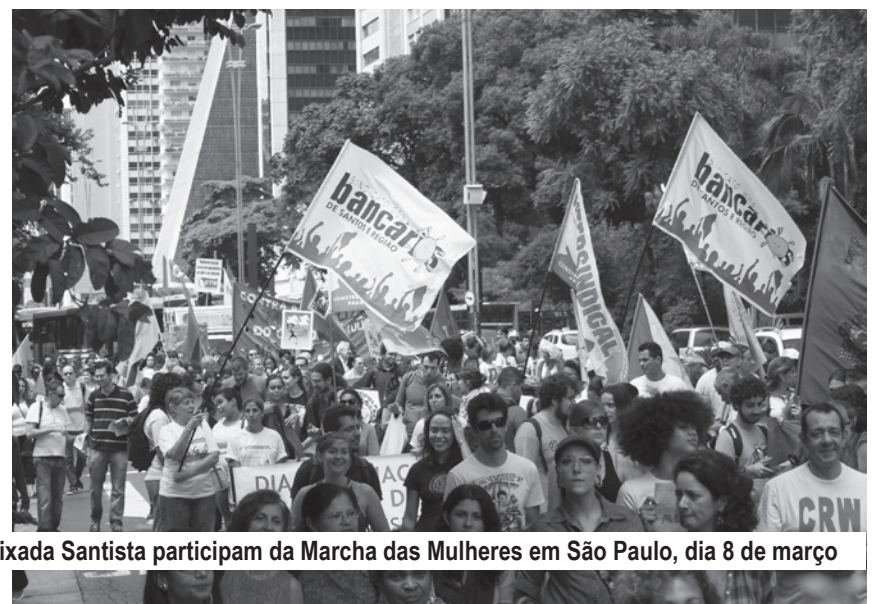
Bancárias da Baixada Santista participam da Marcha das Mulheres em São Paulo, dia 8 de março