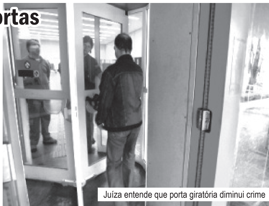
Juíza entende que porta giratória diminui crime