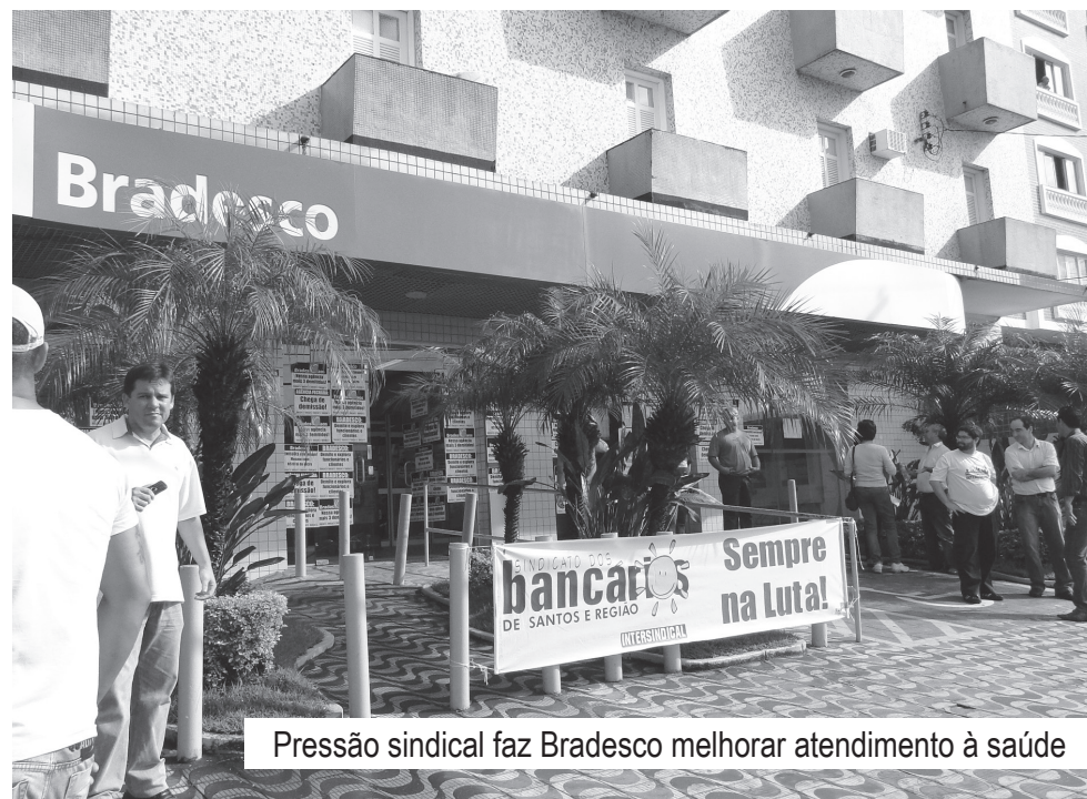
Pressão sindical faz Bradesco melhorar atendimento à saúde

Diversas vezes funcionários deixaram de ser atendidos por clínicas credenciadas. Caso isto aconteça denuncie ao Sindicato.