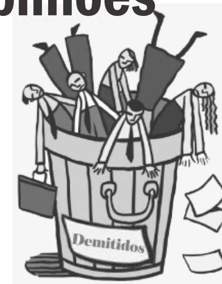
Itaú trata seus funcionários como lixo

Por isso temos quase certeza de que já deve estar em cinco mil ou mais bancários que perderam seus empregos no Brasil.