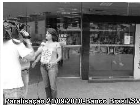
Paralisação 21/09/2010 - Banco Brasil/SV