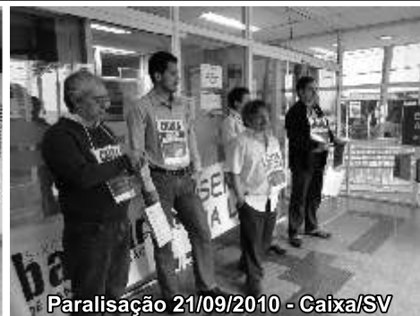
Paralisação 21/09/2010 - Caixa/SV