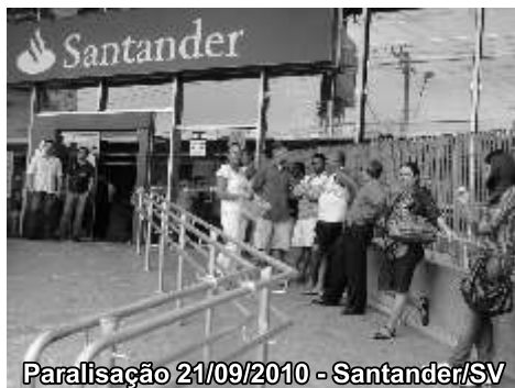
Paralisação 21/09/2010 - Santander/SV