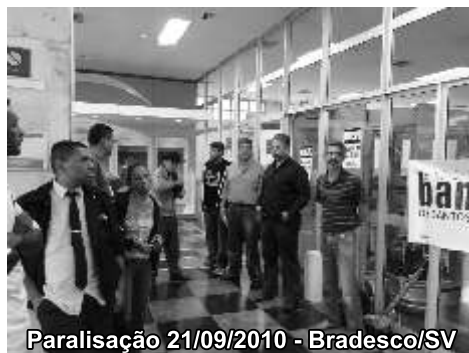
Paralisação 21/09/2010 - Bradesco/SV

Não deixe que decidam por você, a sua participação é determinante!!!