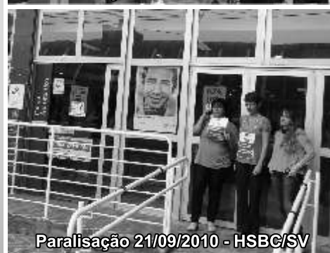
Paralisação 21/09/2010 - HSBC/SV