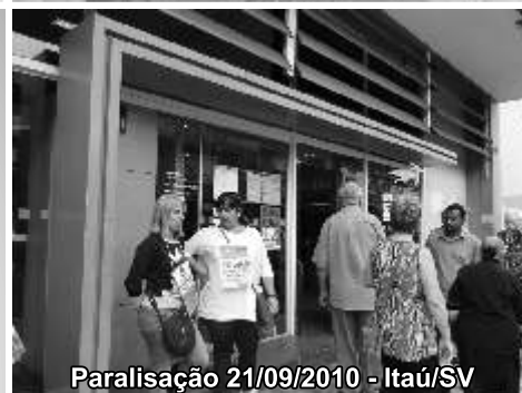
Paralisação 21/09/2010 - Itaú/SV