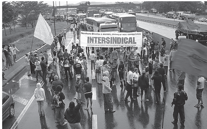
Os trabalhadores não vão pagar a conta da crise feita pelos capitalistas

Lula, por outro lado, auxiliou com dinheiro público os bancos com mais de R$ 160 bilhões, as montadoras com R$ 4 bilhões e com R$ 7 bilhões do BNDES a Embraer, sem a contrapartida da