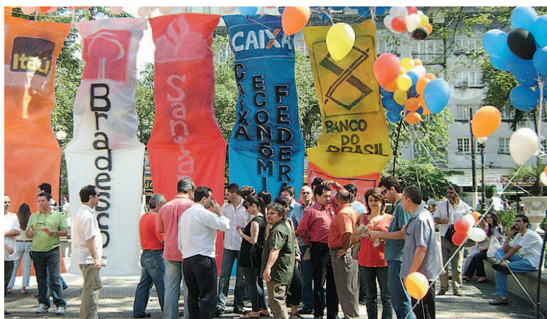
A diretoria participou juntamente com vários bancários

Obs.: Leia a íntegra das reivindicações no site www.santosbancarios.com.br