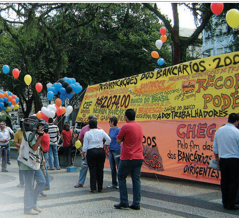
Os bancários exigem reposição das perdas e um piso de R$2.074,00

Os bancários exigem melhores condições de trabalho, piso salarial de R$ 2.074, fim das metas, o gatilho salarial, a PLR de 3 salários mais R$ 3.500, vale-refeição de R$ 17,50, cesta-alimentação de R$ 415,00, reajuste de no mínimo 13,23%, como foi aprovado na Conferência Nacional dos Bancários, de 27 a 29 de julho, pela maioria dos delegados, pois o Sindicato de Santos e Região defendeu, junto com outros, o índice de 18%, que