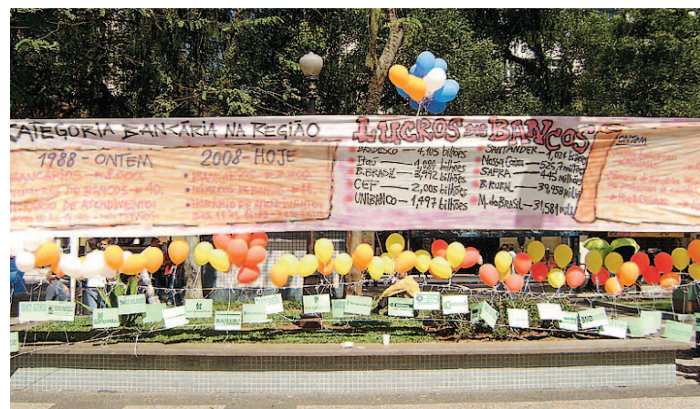
Foi armado um verdadeiro circo na Pça. Mauá, dia 27