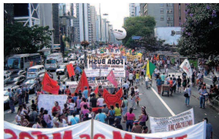
Cerca de 20 mil pessoas gritam Fora Bush, no Dia das Mulheres

paz de conviver com manifestações democráticas da sociedade, particularmente com as promovidas pela classe trabalhadora e pelos movimentos sociais e populares, a Polícia Militar de José Serra bateu, atirou com ba-