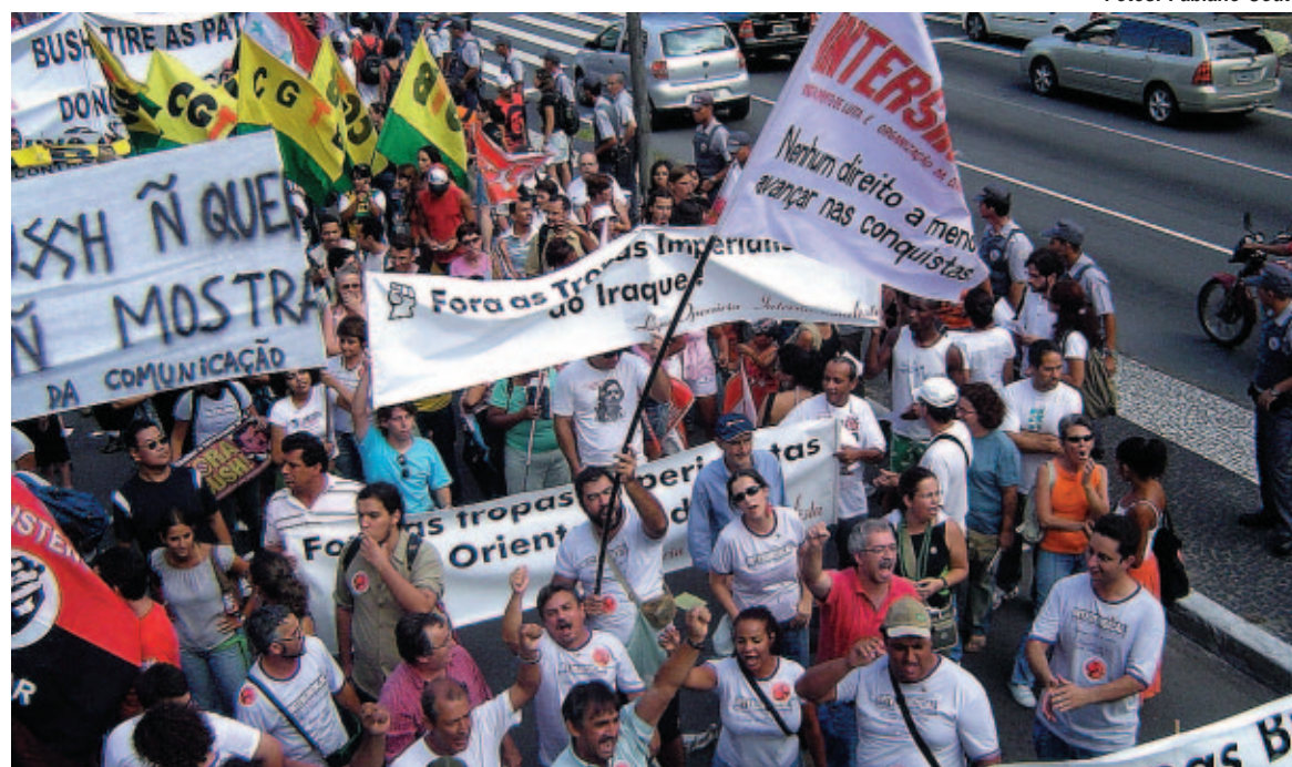
Dirigentes sindicais contra a guerra do Iraque e o imperialismo dos EUA

Não se enganem, Bush veio ao Brasil para agilizar e fiscalizar as reformas pro-