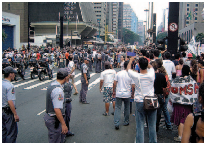
Polícia truculenta inicia repressão contra manifestantes

las de borracha e jogou bombas de gás lacrimogêneo e de pimenta contra os manifestantes ferindo diversas pessoas. Chega de interferência na soberania dos povos: Fora Bush da América Latina e Lula do Haiti!!!