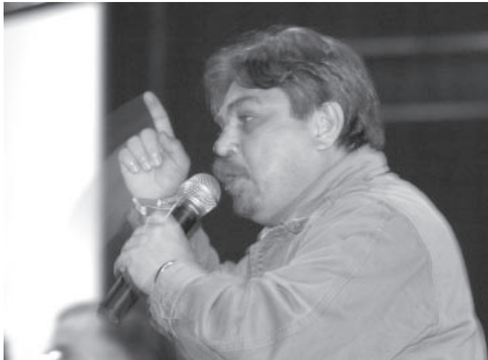
Sindicato defende o fim das metas abusivas

Santos, junto com alguns outros, defendem o índice de 13,98% das perdas salariais de setembro de 94 a agosto de 2006 + 3,99% a título de produtividade o que totaliza 18,5% de reajuste, outros quatro índices foram apresentados por diversas tendências sindicais (ver tabela).