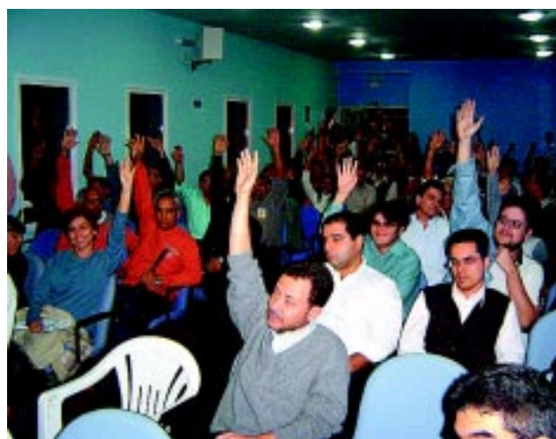
Funcionários rejeitam PLR, após greve de 24hs e BB melhora a proposta 27/Setembro/05