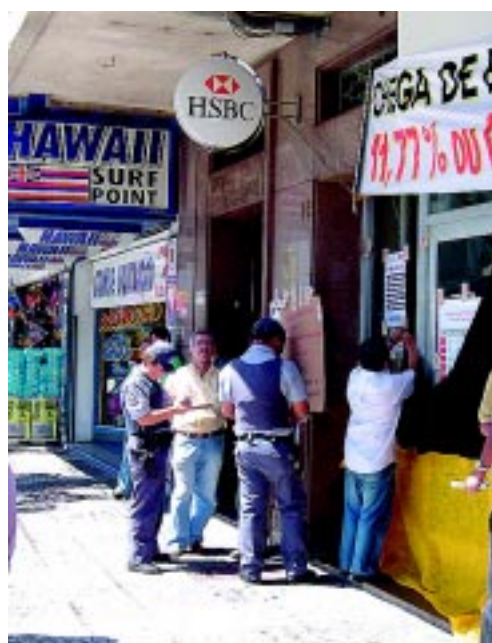
Paralisação HSBC/24 hs - Santos Setembro/05