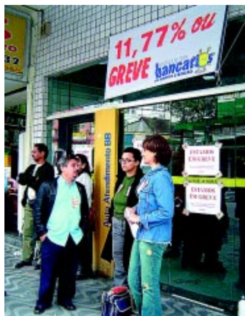
Greve dos Bancários/2005 - BB