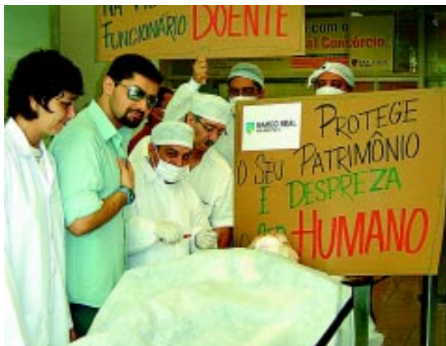
Uma semana de luta no Real/SV Agosto/05