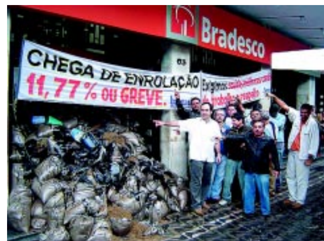
Paralisação Bradesco Pça. da H em Santo Setembro