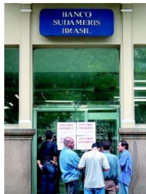
Greve dos Bancários Sudameris Pça. Mauá Santos