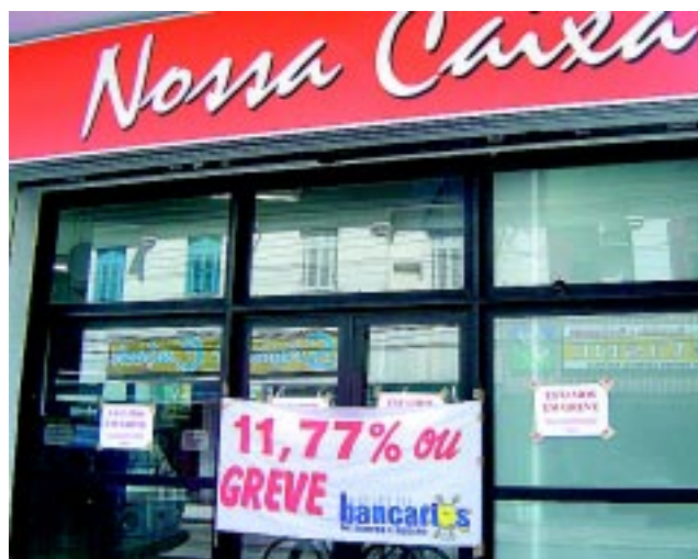
Greve dos Bancários / 05 Banco Nossa Caixa