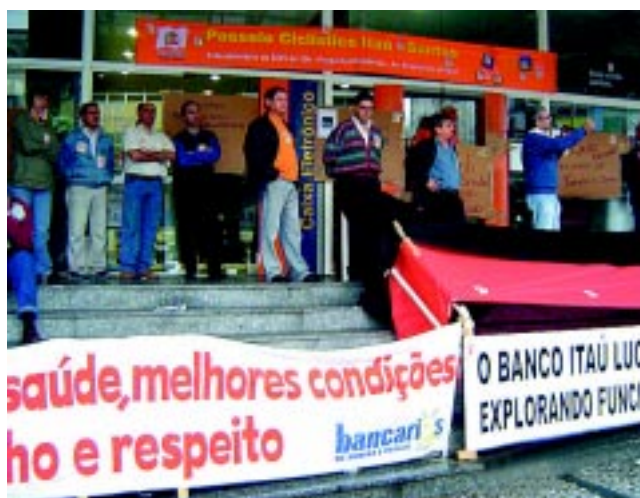
Paralisação Itaú - Centro/Santos Setembro/05