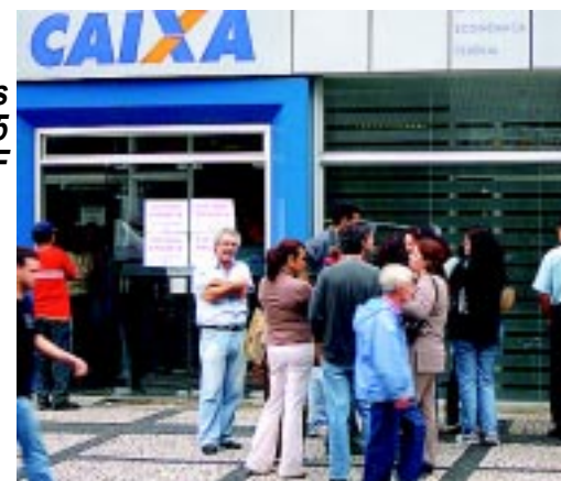
Greve dos Bancários/05 CEF