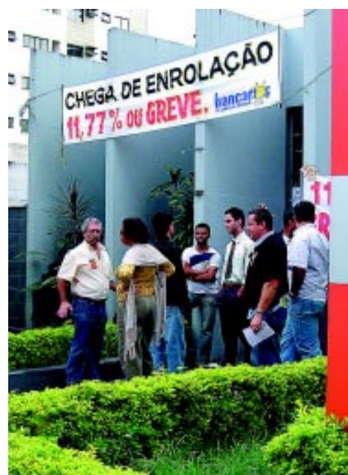
Paralisação do Bradeso da Epitácio Pessoa/Santos