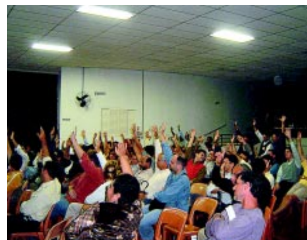
Assembléia aprova proposta da FENABAN/05

ÃO PODE FICAR DE FORA. FAÇA A DIFERENÇA!!!