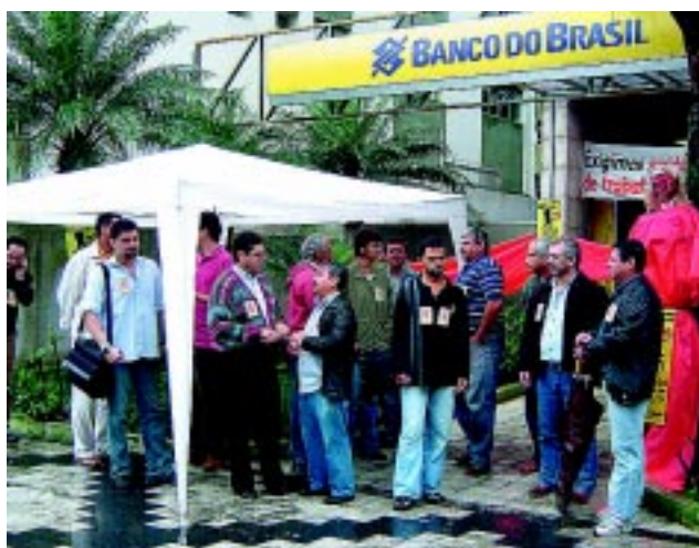
Paralisação BB/24 hs - Guarujá Setembro/05