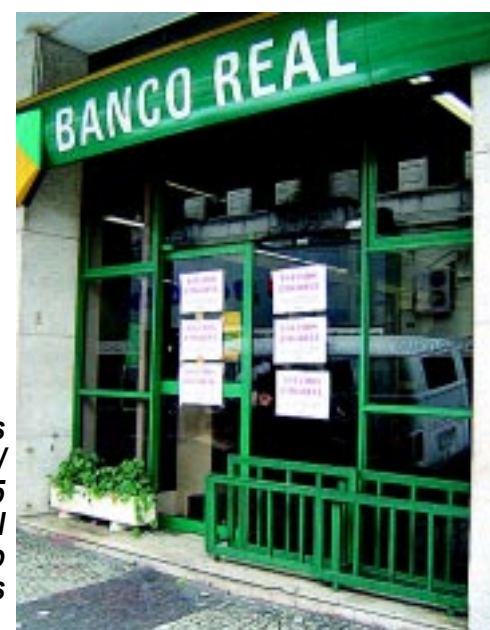
Greve dos Bancários/05 Banco Real Centro Santos