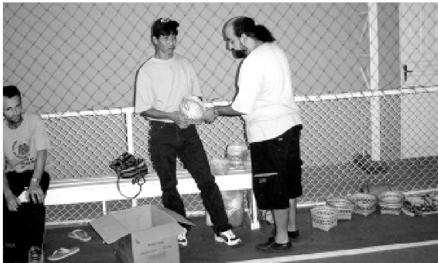
Vários artesanatos foram vendidos para angariar fundos para a tribo