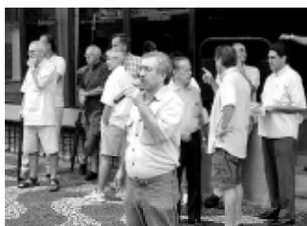
Aposentados participaram da manifestação

Porém, os banqueiros espanhóis agradecem desempregando