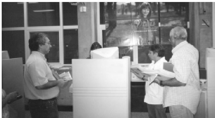
Diretores entregam o jornal nas agências de Santos

Lutamos pela concessão de auxílio-educacional a todos os que ingressarem ou já estejam cursando o nível superior de en-