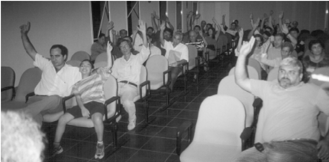
Bancários são unânimes em aprovar a minuta e o reajuste reivindicado

A categoria deliberou por aprovar as reivindicações da minuta entregue pela Executiva dos Bancários à Federação Nacional dos Bancos (Fenaban), dia 31/07, em Assembléia Geral Extraordinária convocada pela diretoria do Sindicato, realizada no dia anterior.