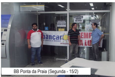
BB Ponta da Praia (Segunda - 15/2)