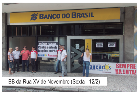
BB da Rua XV de Novembro (Sexta - 12/2)

As paralisações iniciaram, dia 12/2 (sexta), das 8h às 11h, no prédio da XV de Novembro (onde existem diversos departamentos), e teve a adesão de mais 9 agências em Santos, totalizando 10 neste dia. No segundo dia (segunda), 15/2, mais cinco agências amanheceram paralisadas, sendo quatro das 8h às 11h. Já a da Nova Noroeste/Santos foi tratada de modo especial e ficou sem atendimento ao público durante todo o dia, porque exatamente nesta unidade uma caixa foi descomissionada.