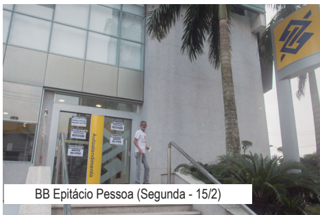
BB Epitácio Pessoa (Segunda - 15/2)