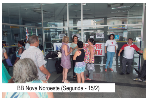
BB Nova Noroeste (Segunda - 15/2)