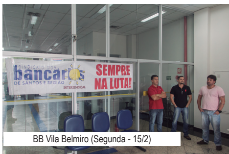
BB Vila Belmiro (Segunda - 15/2)