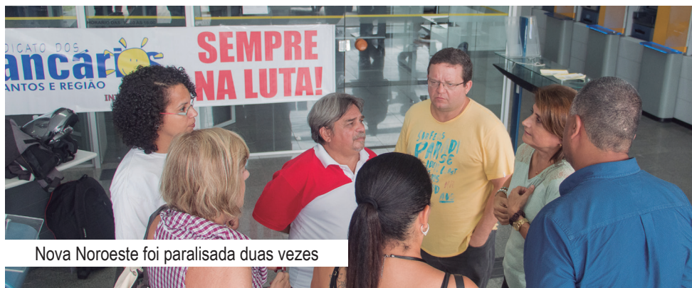
Nova Noroeste foi paralisada duas vezes