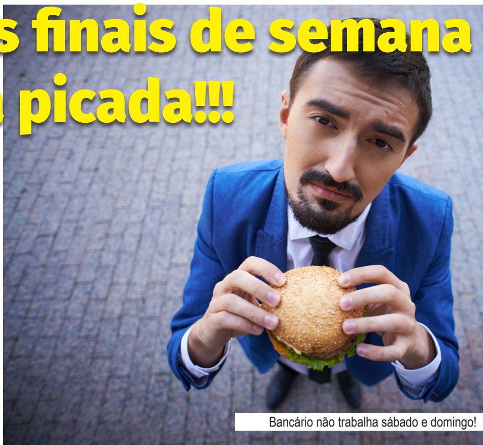
Bancário não trabalha sábado e domingo!

No banco espanhol o lucro é acima da alimentação, o assédio é velado ou você vende o peixe enfiado goela abaixo ou você não come, nem compra e ponto.